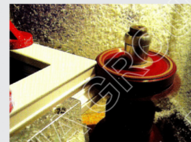
WZ 104 - 3 freze